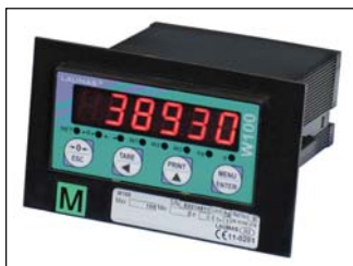
Supporto per etichetta metrica (dimensioni: 124 x 77 x 1.5 mm). Support for metric label (dimensions: 124 x 77 x 1.5 mm).