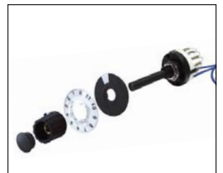
Commutatore per selezione 12 gruppi da 5 setpoint. Selector switch for 12 groups of 5 setpoint.