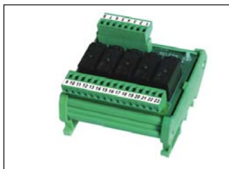
Modulo 5-relé esterno per aumentare la portata dei contatti di scambio a 2A/115Vac. External 5-relay module to increase the capacity of SPDT contacts to 2A/115Vac.